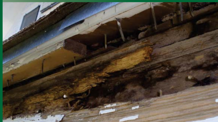
DINDING KAYU DIMAKAN RAYAP DAN BERJAMUR

Isi per dus : 10 lembar Warna Tersedia : Light Grey & Dark Grey