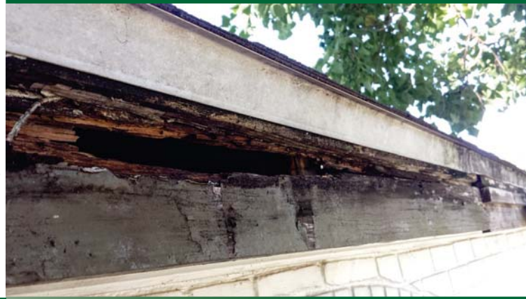
LISTPLANK KAYU RUSAK AKIBAT RAYAP DAN CUACA